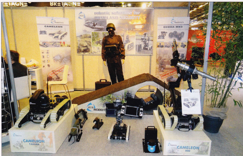
Az új kicsi, de annál hatékonyabb robotok

A legmeghatározóbb kiállító országok – Franciaországon kívül – az USA és az Egyesült Királyság, továbbá