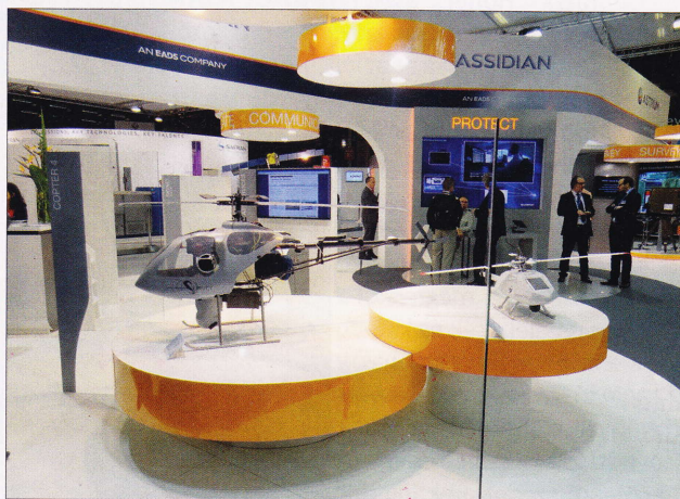
Drónok a felderítés szolgálatában

A technológiai újdonságok között különösen figyelemre méltó a robotok