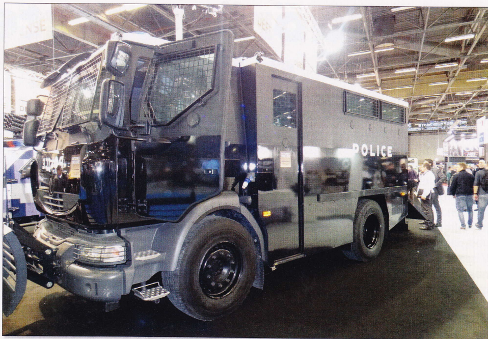
A legújabb rendőrségi gépjármű

Németország, Oroszország, Olaszország, Izrael Kanada, Svájc, Ausztria, Spanyolország és Belgium. Érdekes volt látni Csehország és Horvátország aktív jelenlétét, s Romániából is volt kiállító. Egyre jelentősebb az ázsiai országok részvétele: Kína, Pakisztán. Brazília is sok céggel képviseltette magát. Nagy presztízt jelent az országoknak jó termékekkel, újdonságokkal való megjelenés ezen a rangos eseményen. S láthatóan nagyon sok cég kereste a kapcsolatokat – Magyarországgal is – képvisleti megbízás céljából. Az ünnepélyes megnyitóra Párizsba érkezett három kontinens tizenhét országának belügyminisztere.