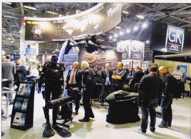
A GK PRO standja, a francia rendőrség legnagyobb beszállítója

ta a rendőrség, a csendőrség, a hadsereg, a tűzoltóság és a katasztrófavédelem számára kifejlesztett legkorszerűbb termékeket, s emellett egyre több olyan eszköz és berendezés is megtalálható volt, amely a civil biztonsági szféra, illetve más, a rendvédelem munkáját segítő, vagy adott feladatokat átvállaló civil szervezetek és vállalkozások számára készültek.