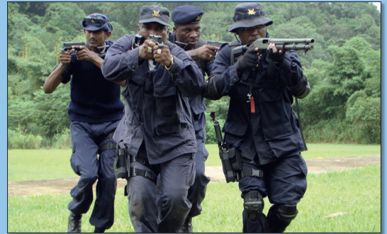
Trinidad és Tobago — a különleges alakulat kiképzése