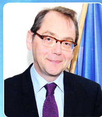
Roland Galharague Franciaország nagykövete Ambassador of France