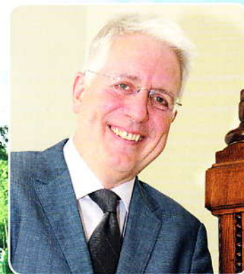
Imants Liečis Lettország nagykövete Ambassador of Latvia