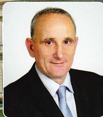
Gémesi György Gödöllő polgármestere Mayor of Gödöllő

Az EU-tagság Magyarország sikertörténete