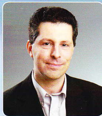
Schiffer András, az LMP társelnöke Co-President of LMP