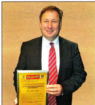
AZ ÉV BIZTONSÁGVÉDELMI SZAKEMBERE 2013